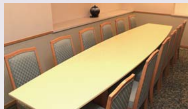
テーブル席 (12名まで)